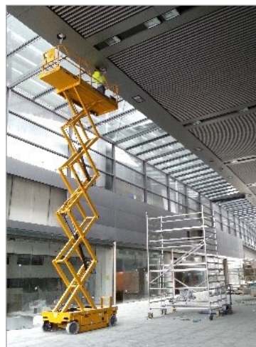
VOR Installation der Leuchten-Lifte: komplex, riskant, teuer

Nach Installation der REEL TECH Leuchten-Lifte erfolgt diese Arbeit gefährlos - ohne Hebebühnen und stromfrei (!). Die Böden bleiben unbeschädigt; und sowohl die Planung eines Wartungseinsatzes, als auch die Durchführung können jetzt rasch und einfach umgesetzt werden – der Passagierverkehr erfolgt weiterhin ungestört und sicher.