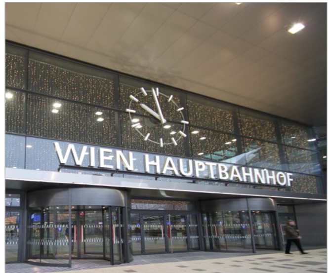
Der neue Wiener Hauptbahnhof, Eröffnung 2014: Modern und zeitgemäß in Architektur und Ausstattung.

Das Wiener Unternehmen REEL TECH schreibt mit seinen innovativen Leuchten-Liften eine europäische Erfolgsgeschichte: in nur 7 Jahren nach Gründung des Unternehmens im Jahr 2008 wurden europaweit bereits über 15.000 REEL TECH Leuchten-Lifte installiert. Ein weiteres Vorzeigeprojekt wurde 2014 mit der erfolgreichen Inbetriebnahme modernster Anlagen am neuen Hauptbahnhof Wien umgesetzt.