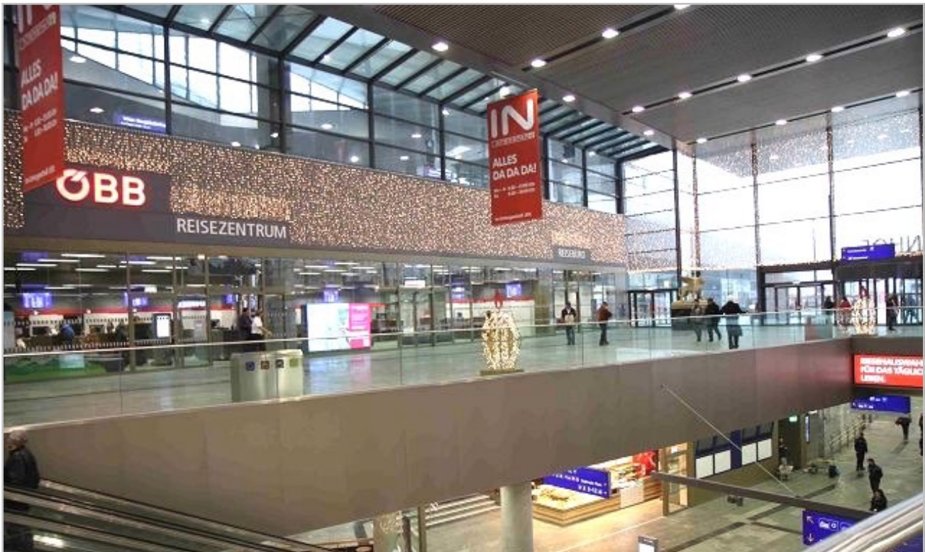
Wien-Hauptbahnhof: REEL TECH Leuchten-Lifte erleichtern Wartungsarbeiten in Hallen, über Stiegen und Rolltreppen.