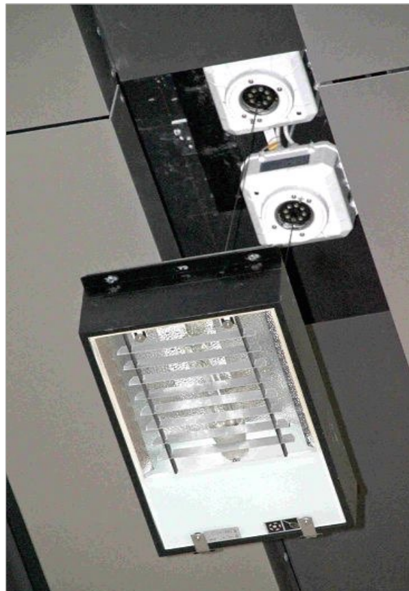
Bei den Synchron-/Banner-Liften am Hauptbahnhof sind eigens angefertigte Aufhängungen und Revisionsabdeckungen im Einsatz. Die Lifte-Typen PSI-20 MB sind bei Absenkung der Leuchten gut sichtbar (Synchron Ausführung, um paralleles Abfahren zu gewährleisten).

Dieser Lift-Typ eignet sich für den Einsatz in Hallen jeder Art. Er ist ohne erheblichen Investitionsaufwand montiert und wird deshalb gerne von Architekten und Lichtplanern für den Industrieinsatz herangezogen.